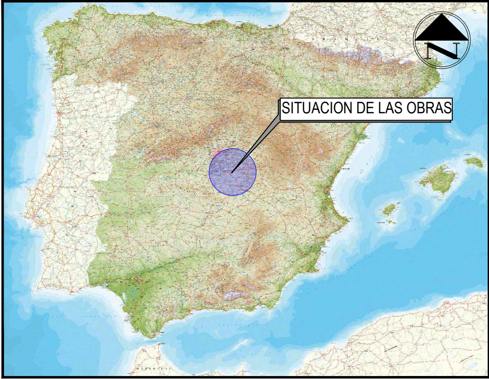
SITUACIÓN DE LAS OBRAS EN ESPAÑA SIN ESCALA