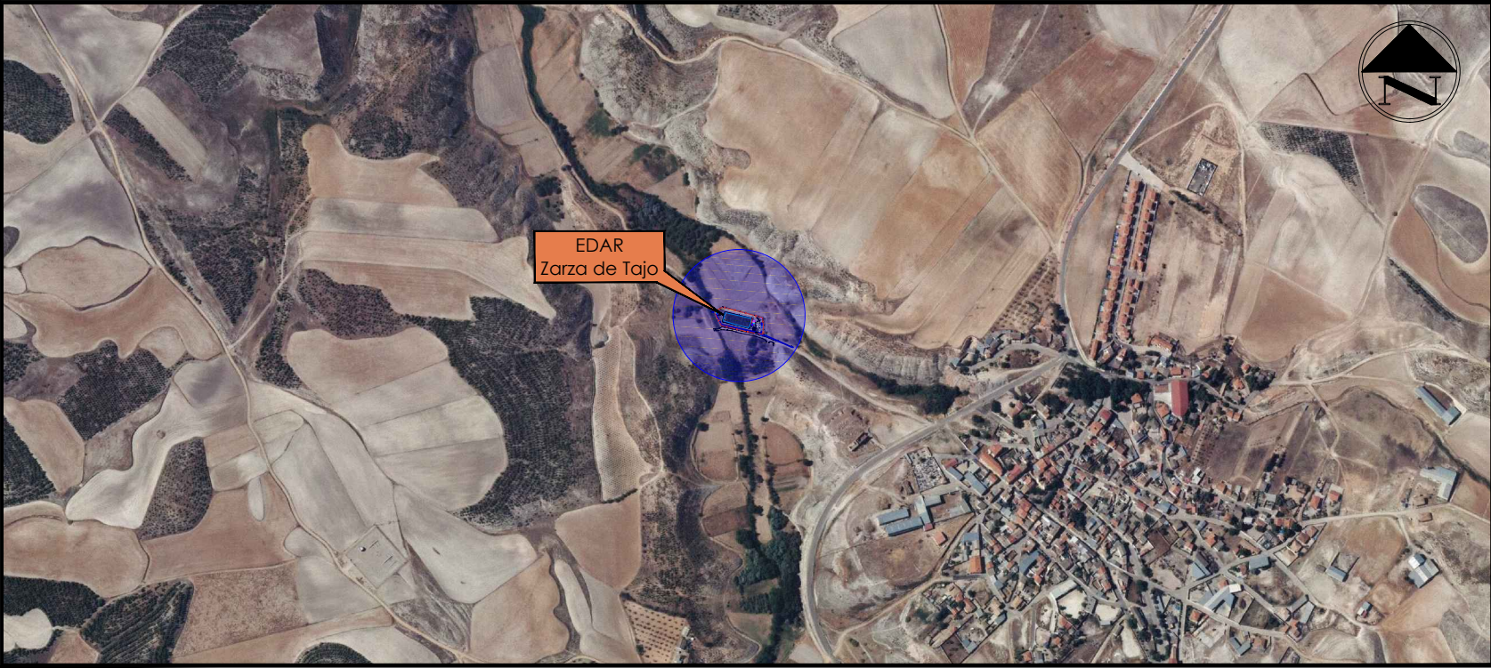
EMPLAZAMIENTO DE LAS OBRAS ESCALA 1/10.000