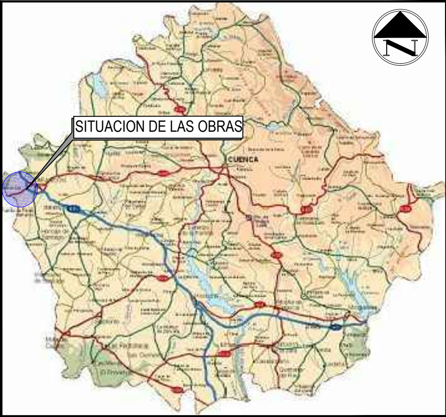
SITUACIÓN DE LAS OBRAS EN LA PROVINCIA DE CUENCA SIN ESCALA